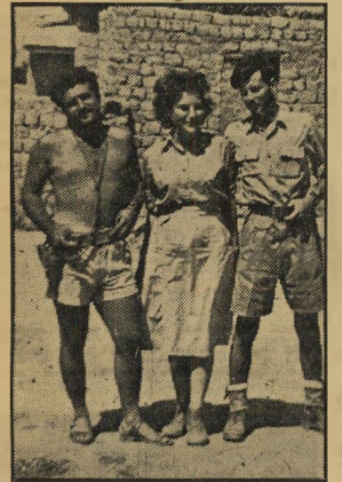
בחטיבת נבטני, מקלט על האף.

מכה של אלה על הראש היא שיטה יעילה מאוד. להכניס לתוכו מחשבות מסוימות. אולם כששכב השבוע במיטתו הלבנה במח-