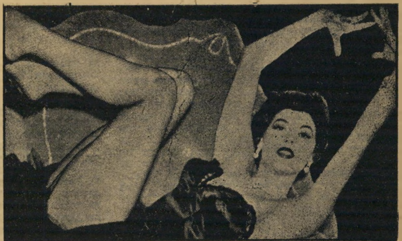
כוכבת אלה גארדנר ילדים תיכף ומיד.