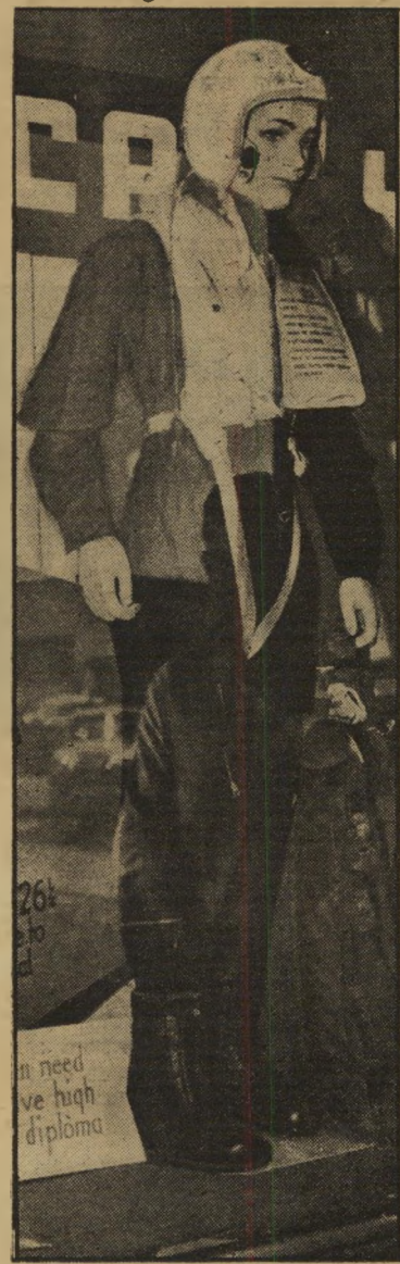
גובת תעמוזה לחיל התעופה 76% יותר מתחנתו

בבונקר מבוצר של סטאלינגראד המוכרתת קיבל גנרל גרמני טיפוס את המברק, משך בכתפו. לפני ימים מעטים כלבד נתמנה לפלד-מארשאל, כאות הוקרה מיוחדת על מלחמתו העקשנית בעיר שנשאה את שמו של הגנרל של סטאלין. המטוס חיכה לו. אולם עתה החליט להפר את הפקודה: הוא לא יעזוב את חייליו. כעבור שעות מעטות צעקו תחנות השידור מסביב לכדור הארץ: ה' מארשאל פון-פאלוס, נצר אחת המשפחות