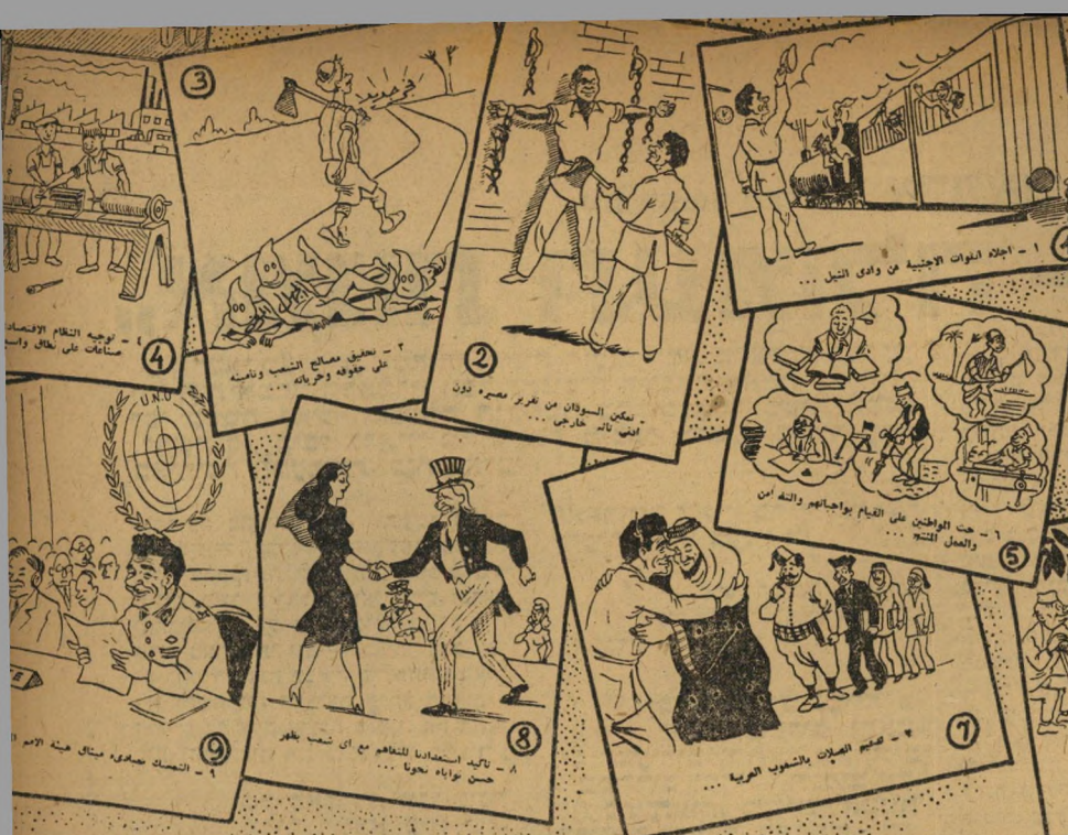
תשעת עקרונות ההפיכה המצרית הנשר יוצא למלחמה

הרئيس مولد هيئة التحرير في مهرجان الوطني... وقد تناول رسام (الأتين) عناق الهيئة... في هذه الرسوم التي ترى على هاتين الصفحتين