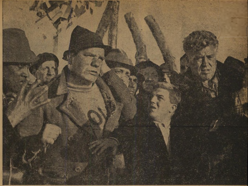
נס במילאנו (איטליה)