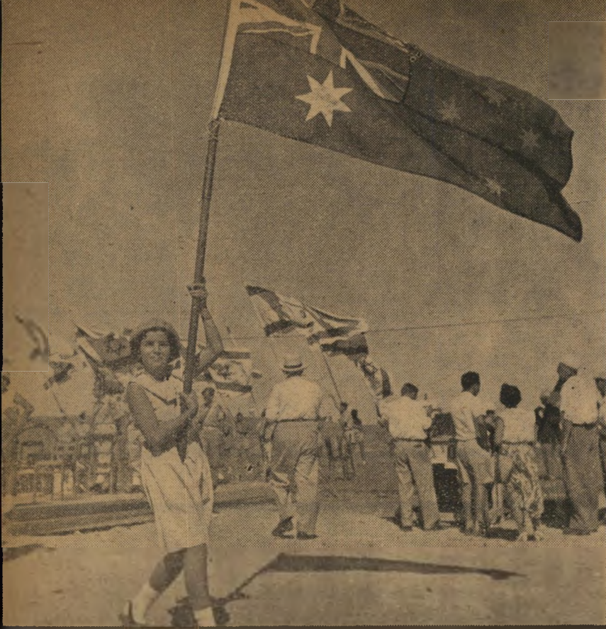
עשרות הדגלים. הדגל האוסטרלי, אחד מעשרות דגלים של מדינות וארגוני ספורט שהועברו על-פני במת הנשיא במיצעד הפתיחה של המכביה. מונף בידי ישראלית צעירה.

הכשלון הרציני הראשון בא עם הופעת משלחת ישראל על מגרש המצעד. בחלקו אחראים לו המארגנים, שקבעו כי משלחת ישראל תצעד בגופיות ומכנסי ספור-רט. תלבושת זו נראתה מגוחכת אחרי תל-בושות הפאר של האורחים, גרמה לכך ש-50 מתחרי האתלטיקה הקלה סירבו להשתתף במצעד, מחשש הצטננות ערב התחרויות. אך את מרבית הכישלון יש לוקוף לחוב-תו של סעיף זעירי בהסכם מכביה הפועל, שעסקו עד רגע הפתיחה בהתמודדות הר-דית: הוא הזמין 1500 איש מכל ארגון להש-תתף במצעד. התוצאה: מיד לאחר 500 ה-