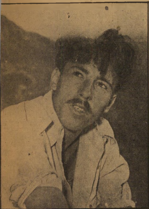
סולל כביש סדום