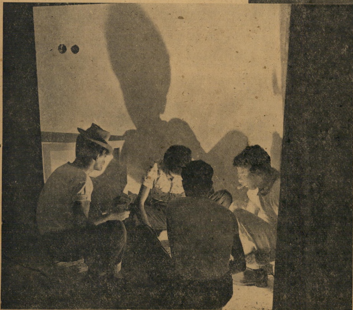
המשחק שמעבר לגבול. — משחק פוקר, על סכומים גבוהים, בבניין גמור-למחצה. מנין להם סכומים כאלה? ישנם מקורות...