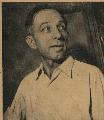
י.מהרר, מנהל המדור לטיפול בנוער

הצעירים בהם בכל דרכי הפשע. ביום שהם עוברים לשיפוט של בתי המשפט הרגילים, זוכים הם למסר ממושך.