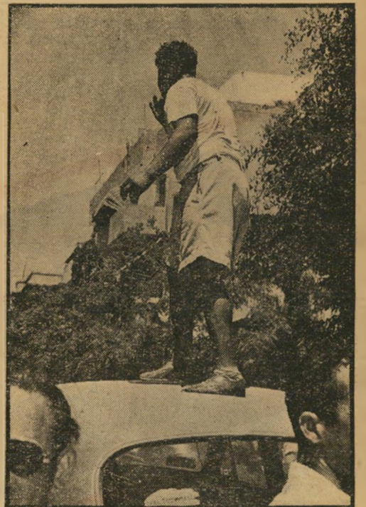
מנהיג-נהג נואם הקשי ששבר את המונית.