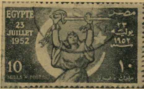
בול מצרי לכבוד יום ההפיכה.

● בסוריה, הקים אויב אלי-שישקלי משטר רוני-פאשיסטי מובהק, הנתון כולו להשפעת בעלי האחוזה. שישקלי ניסה לרכוש את ההמונים על-ידי חלוקת קרקעות-בור ממשלתיות, בממדים קטנים. הקמת משטר עממי אמיתי במצרים עלול להדגיש את הוויף שבשטרן שלו.