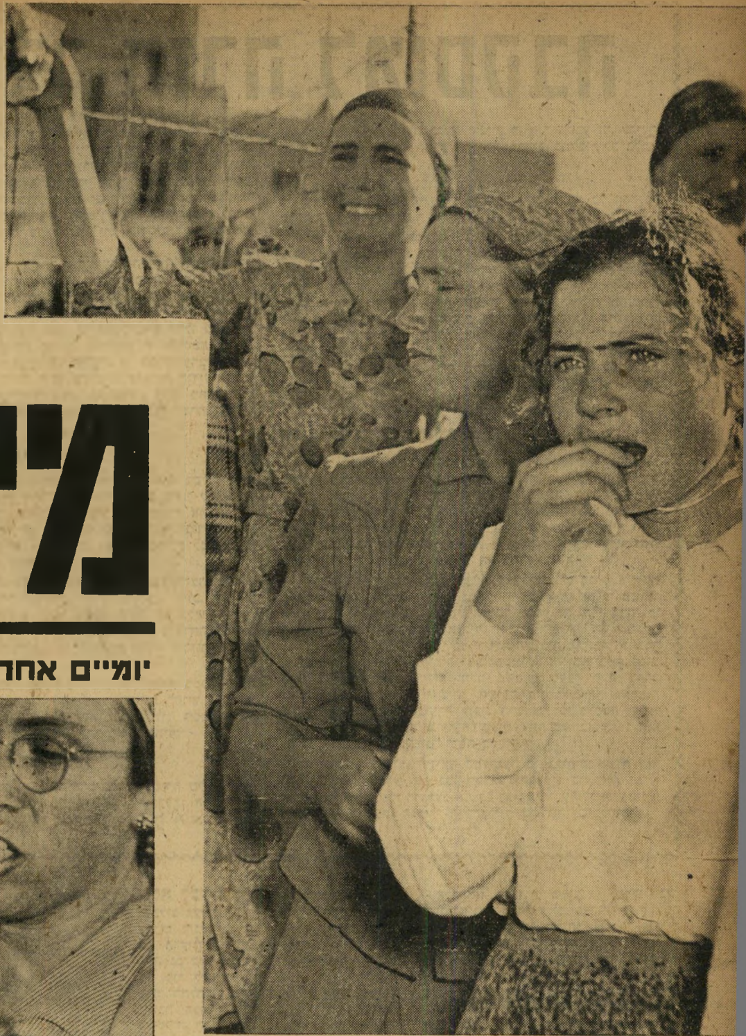
הבת-בוכה מהתרגשות - האם (למטה) קוראת תהילים

שיעמום עמוק אסף את הכנסת. החום המחניק ירד על אולם הישיבות, שהיה כמעט ריק מאדם, ואפילו ההשכחות ההדדיות הרגילות היו חיורות והסרות-עינין. במזנון ישבו ח"כי כל המפלגות בצוותא, לגמו מיץ לימון והחליפו הרהורים נוגים על חוסר-התכלית בשיבה במוסד ריבוני זה, אשר כנח ההכרעה שלו פתח והולך. לפתע מילא רעש מזור את החלל. הוא דמה מאד ליללת חתולים, ההח"כים אצו אל החלונות הגדולים, החלו מצפים בקורת-רוח למהוה שיפיג את השיעמום. הם לא חיכו לשוא. גורל מר ממוזר. לפני הכנסת עמדו כ-300 נשיכי מן השכונות הדתיות, רבושות מספחות-ראש, כמעט כולן בגיל העמידה. המשטרה שקיוותה משום מה שהנשים תעבורנה למשרד ראש-הממשלה. נתנה להם לחדור אל רחבת הכנסת ללא התנגדות. כשהרגישה בטעותה, היה זה מאוחר מדי. המהלומות הראשונות ניתכו על דלת הכנסת ועל חלונות המזנון. גיפיים של המשטרה הוזעקו בבהלה, עשרות שוטרים קפצו מן המכוניות, הסתערו על הנשים. אולם הנשים לא היו מוגות-לב. המטרה העליונה — להציל את בנותיהן מזונת ומגורל מר ממת — חיזקה את גופותיהן המדולדלים. שוב