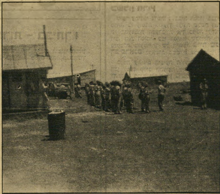
התגבורת מחכה: כיתת שוטרים, שנשמרה כעתודה, ממתנה. חבר מביט בהם ליד הצריף.