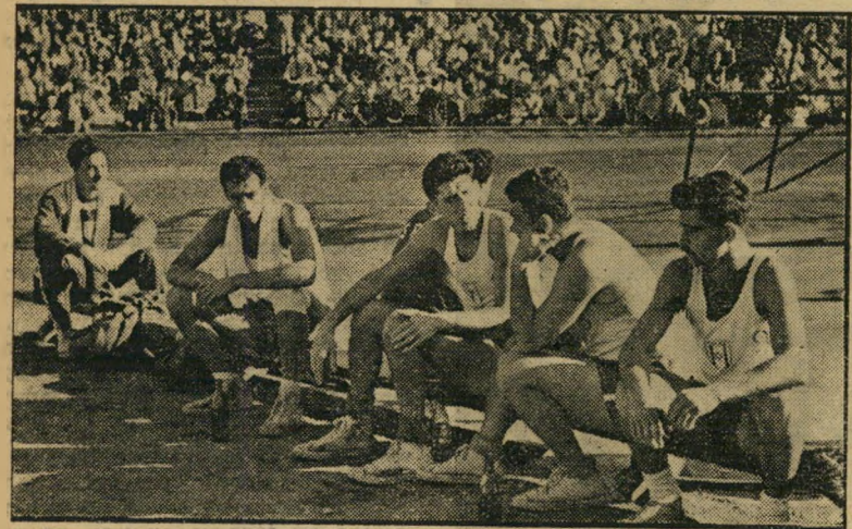
הקבוצה הישראלית אחרי הכשקון נגד ההונגרים מברך דחוף למוסקבה

לפני שש שנים ישב נער תל-אביבי בן 16, נמוך קומה וכבד משקל בין מאות הצעירים הצעירים שמלאו את יציע האיצטדיון התל-אביבי, בלעו בתיאבון כל מאבק שנערך על השדה והמסלול. היתה זו תחרות מרתקת בין אתלטי ה-