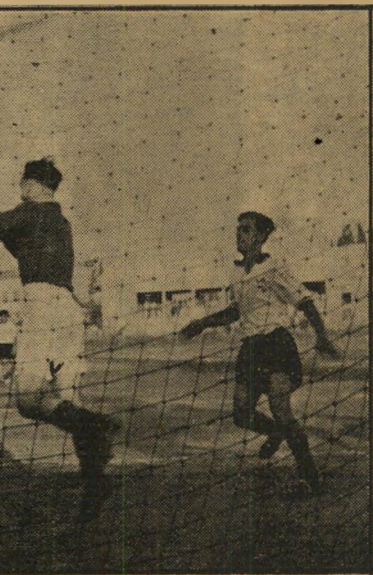
שוער פאלקירק מקיפוט בולם התקפת פתח-תקוה

המקצועיים הסקוטים, שלא התלהבו משני המשחקים הקלים הראשונים, היו עייפים למרות כושרם הגופני המעולה. הסיבה: ה"חום הישראלי הלוהט שהתייש את כוחם ומש"חך הכדורגל החרף מדי של הישראלים שה"פיל בהם פצועים לא מעטים.