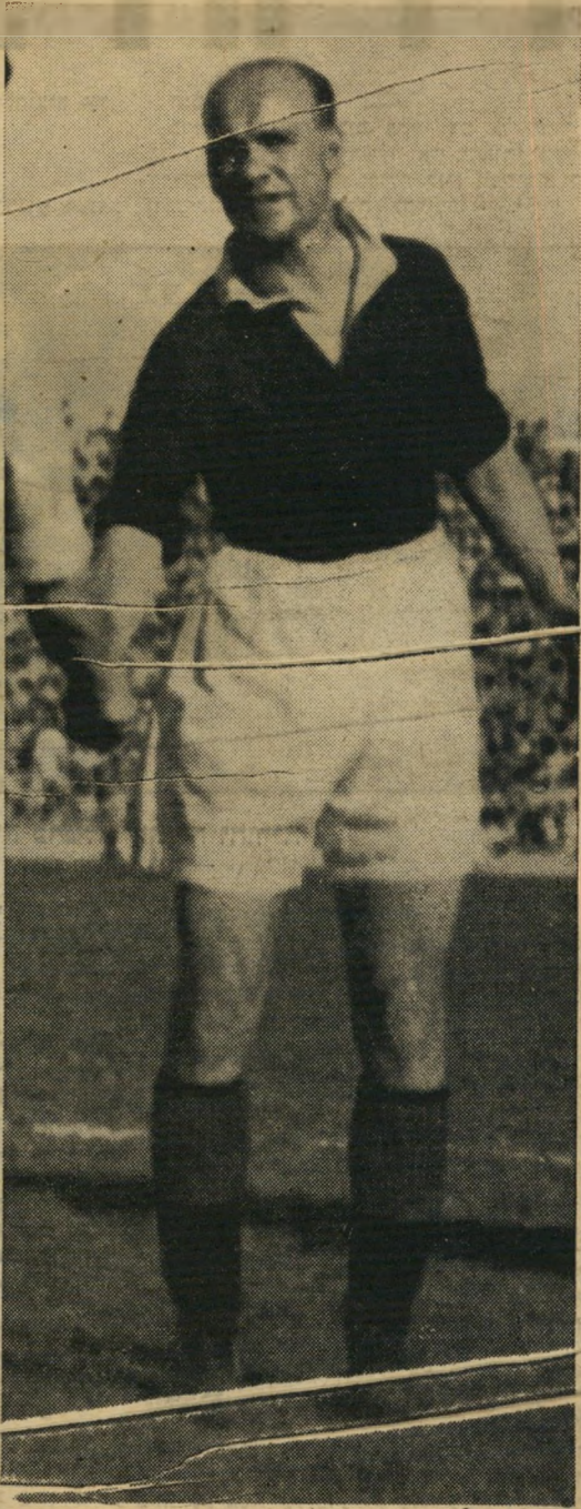
לאחר כמה דקות של עמידת רום זקופה למשמע תקליט שכור שאי פעם באופני דקה בלונדון, הופיעו עניו המנוני בריסניה וישראל פתח ציר ברמיניה מיר פראנסים אונס, את משחק פאנקירק - מכבי תל אביב בעקבות ערימה באה לנפולמן.

של יחסים מתוחים בין שתי האגודות ה- אחיות. לבר מכמה עסקנים במרכז הפועל לא חיך איש. שני השחקנים לא הועילו במאומה לפחות במה שנוגע למשחק עצמו. העגלה המוחלדת התנועעה באטיות, כרגיל. הפועל נוצח 2: 0.