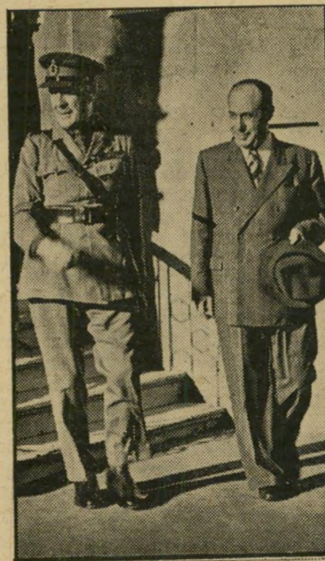
1944 ראש העיר בלוית הנציב העליון, לורד גורס, שבא לביקור נימו- סין לפני בית העירייה בתל אביב.

כשהוקמה המדינה והתקרב מועד הבח- רות לכנסת הראשונה, כבר רבים ששמשו דעכה. כמעט איש לא האמין שראש ה- עיר הממונה יחזיק מעמד בבחירות הבאות לעירייה. יודיו כבר חיפשו לו משרה כמנהל חברת החשמל. במפלגת הציונים-הכלליים דרך כוכבו של פרץ ברנשטיין, שהיה שר בממשלה הזמנית וזכה לשורה של הצלחות. היה ידוע שבגוריון מעדיף את ברנשטיין ההולנדי, בעל המוג הנות, על רוקח, הצבר הנוקשה והתקיף. הציונים-הכלליים ניגשו לחיבור רשימת מועמדיהם, העמידו את ברנשטיין במקום ה-