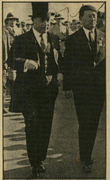
1935 סגן ראש העיר במיפקד החיילים המשוחררים של הגדוד העברי הראשון סימי מלחמת העולם.

מדרגות מפלגתיות. ראש העיר היה חדש של תל אביב לא האמין בנאומים. הוא גם לא האמין במפלגות. הוא החליט ל- התחרות במפא"י בשטח שלה: במעשים. הוא הקים ארגון של ראשוני עיריות ומוע- צות ימניים, שנקרא האיחוד האזרחי. הוא ניסה לגבש כוח כלכלי, מבוסס על הפרדס- גות ושאר מפעלי היוזמה הפרטית.