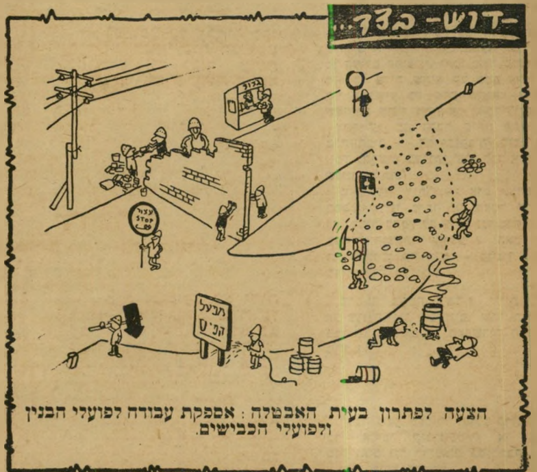
הצעה דפתרון בעית האבטלה: אספקת עבודה לפועלי הבנין ולפועלי הכבישים.

* מספר המובטלים קפץ, תוך שבועות ספורים מ'7 אלף ל'40 אלף, וקרוב לוודאי שיוסיף לעלות.