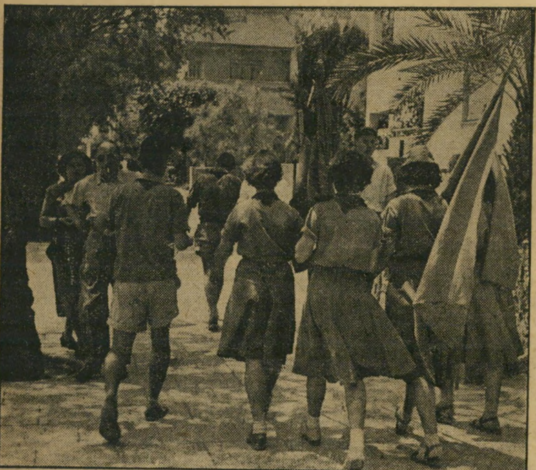
העניין נגמר — קבוצת "השומר הצעיר" חוזרת עם דגלים מקופלים