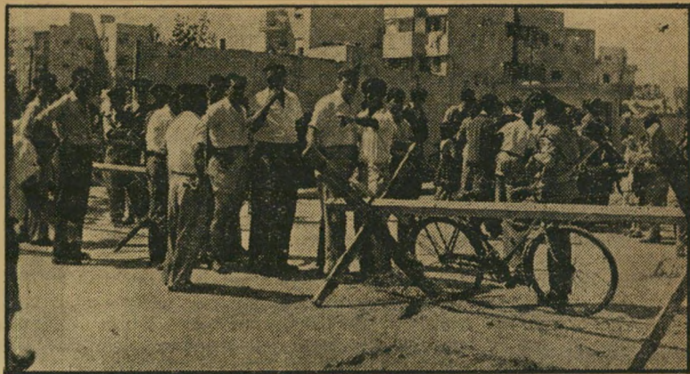
מחוסם במבואות איצטר תל-אביב