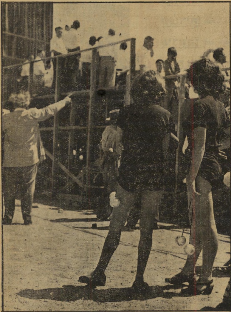
צבי פרידלנדר (שמאל) מביים מא חורי הכמה את המסכת באיצטד

האותות המסתוריים, המבשרים לפקיד ממשלה כי עומד לחול שינוי בהדר הבוס, פעלו השבוע בכמה מסדרונות. הניחושים: דב יוסף, שר-הצנע שושאר בי"לי תיק, עימד להתמנות כשר החקלאות במ"קומו של פרץ נפתלי, שלא התבלס ביותר בי"תפקיד זה. נפתלי עצמו, איש כלכלה מובהק, יהיה מנהל בנק הדואר והבנק הלאומי. דו"ליק הורוביץ, המועמד לתפקיד מנהל הבנק הלאומי, יהיה סגנו. יהיה זה, בין השאר, נצחון אישי חשוב ל"לוי אשכול, שר האוצר. דב יוסף לא קיבל