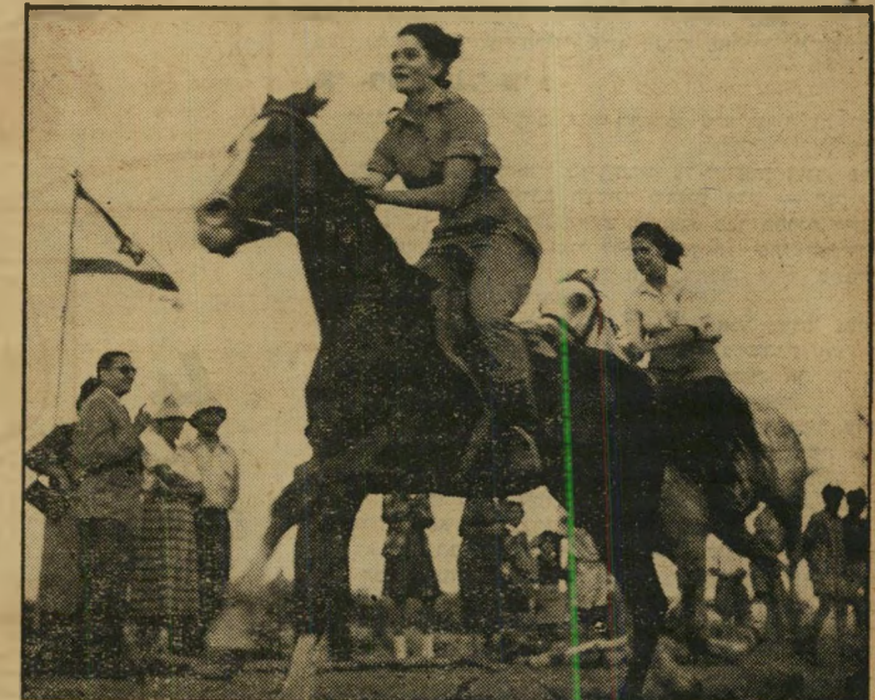
בנות ביום הדרכנות *אם זה מיפגש...*

לפני זמן מה, באולם המדיסון סקהאר גארן, ניו-יורק, התייצבו חמשה רצי מכללות לזינוק בברוך 60 יארד. היו אלה רצים ש־ הבטיחו לצופים קרב מרתק, אם כי לגמרי לא ארוך: 6.2 שניות. הקהל שאג בדיוק 7 שניות ונאלם. הרבה לא ראה, הוא רק ציפה לתוצאות הקרב. אך הקריין לא הוציא הגה מפיו. גם הוא ציפה לתוצאות. הן לא באו. הקהל החל להתמרמר, מתא כף, רקע ברגליו, שרק. לבסוף באה ההודעה: הקריין הודיע