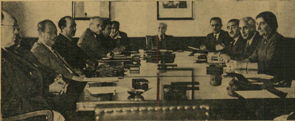
ישיבת מליאת הממשלה. ממשלה X ב. ג.י.

המגע הסודי. למעשה החל המאבק הציפוני עוד לפני 13 חודש, כשקם קונראד אדנאור בבונדסטאג הגרמני-המערבי, הכריז