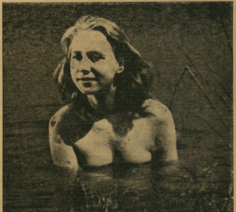
התמונה שנפסלה מתוך "בת אדם" 24 תמונות מכל סרט

הצופים, שנפגע קשות מתמונה עדינה בס' רט בה נראית השחקנית הראשית טוביה מאס רוחצת ערומה בנהר. מיד הריצה הצנ' זורה מכתב בהול אל מפיץ הסרט, דרשר ממנו לקצץ את התמונות הנוראות.