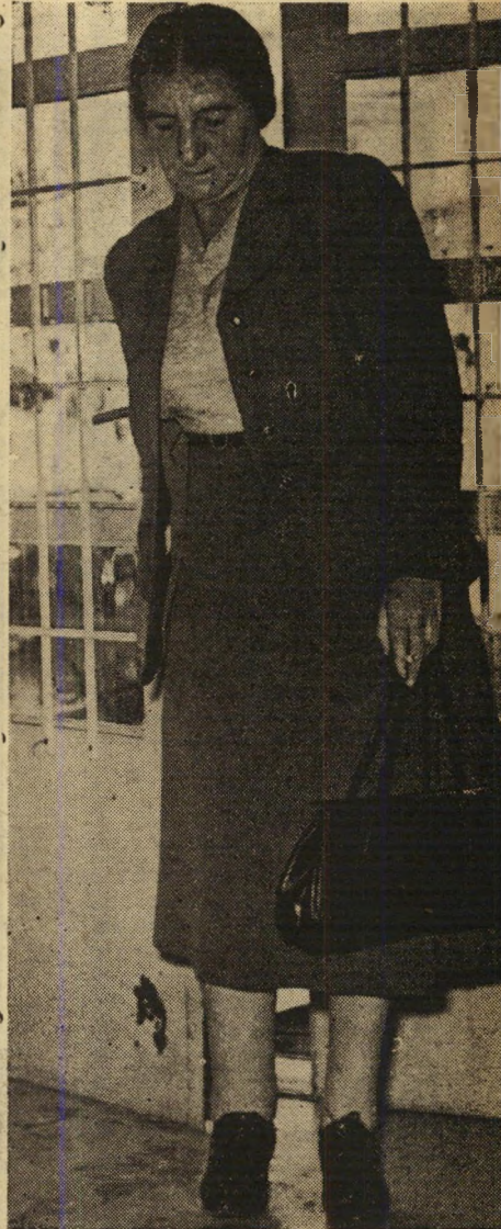
שרת-העבודה גולדה מאירסון מועמדים טבעיים לבית-הסיהר...