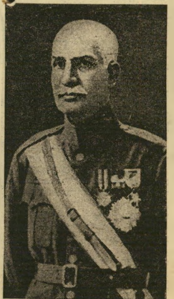
ריזא שאח פחלוי הבן נשאר

הבן לא מתערב. מאז עברו ששה חדי שים. השאח המשיך לשבת בארמונו — אך לא בחיבוק ידים. הוא חדל אמנם להתערב בעניינים פוליטיים, לא קבל שגרירים ומדי נאים להתעצויות. גם המאבק החריף על