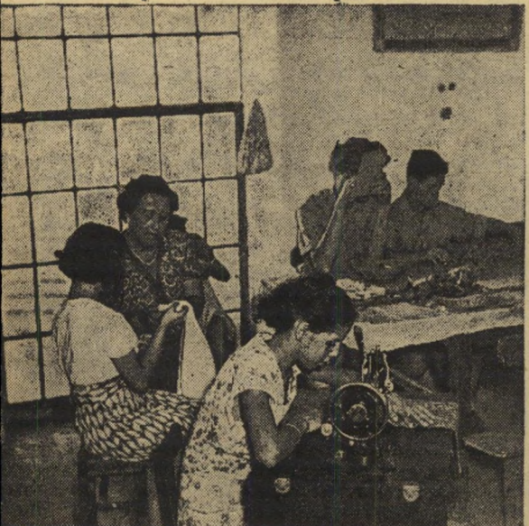
מקצוע לבנות. בבית המלאכה לתפירה מקבלות התלמידות הדרכה מעשית משך ארבע שעות כל יום.

„מדוע הרגת את בנך?” לגבי החברה שווים כל הסוגים — היא מתעלמת מקיומם. אולם מדי פעם מצלית אחד המקרים לכפות עליה את עצמו: אם מטביעה את בנה בים נתניה, אב המרעיל את בתו בדירה תל-אביבית, מאבד את עצמו לדעת כעבור שעות מספר. רק אז מתנערת החברה — או לכל הפחות מנגונה המשטרתי והמשפטי. „מדוע הרגת את בנך?” הם שואלים את האם.