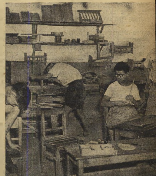
הכנה למקצוע. בין שאר השיעורים שילד מפגר מקבל — שיעורי מלאכה ונגרות.