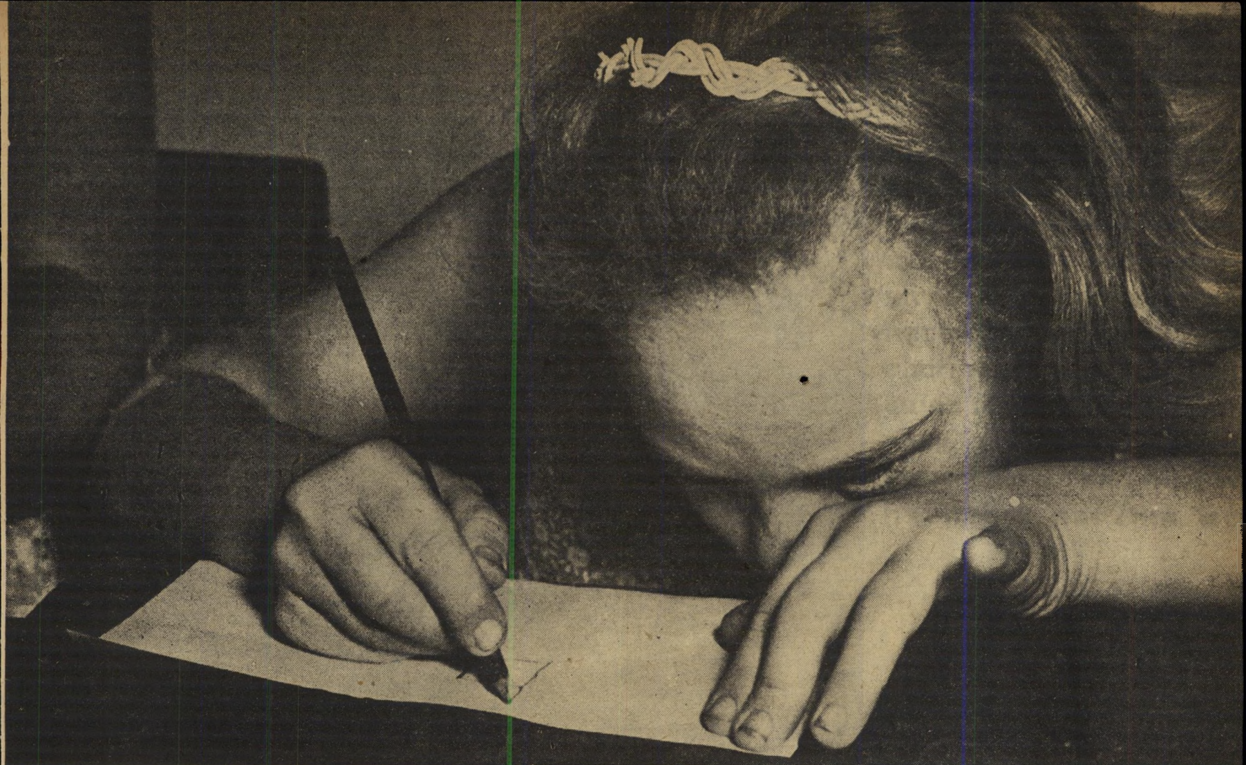
תינוקת בת 13. הנערה המציירת ציורים של תינוק היא בת 13 שנה. ציורים כאלה מהווים חלק חשוב של תוכנית הלימודים, עוזרים למורים להבין את נפש תלמידיהם.

אולם גישה זו, אשר הורים רבים של ילדים מפגרים מסכימים לה, היא רק להלכות שאך נולדו, בעוד שהמצב לאמיתו הוא כי בארץ חיים כיום קרוב ל-800 ילדים מפגרים (מלבד המקרים הקשים ביותר שקרבנותיהם נמצאים במוסדות סגורים). מה מצבם? איזה טיפול ניתן להם? האם הוא מסטיק? „איך אפשר לקבל ילד כזה?” לא הרחק מכיכר דיונוף, תל-אביב, עומד בית גדול ומכוער, אחד הראשונים שנבנו בעיר, והו בית הטיפוח השייך כיום לעירייה. כאן