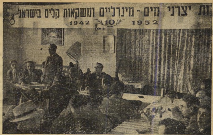
יצרני הגזון בכנס העשור של התאחדותם