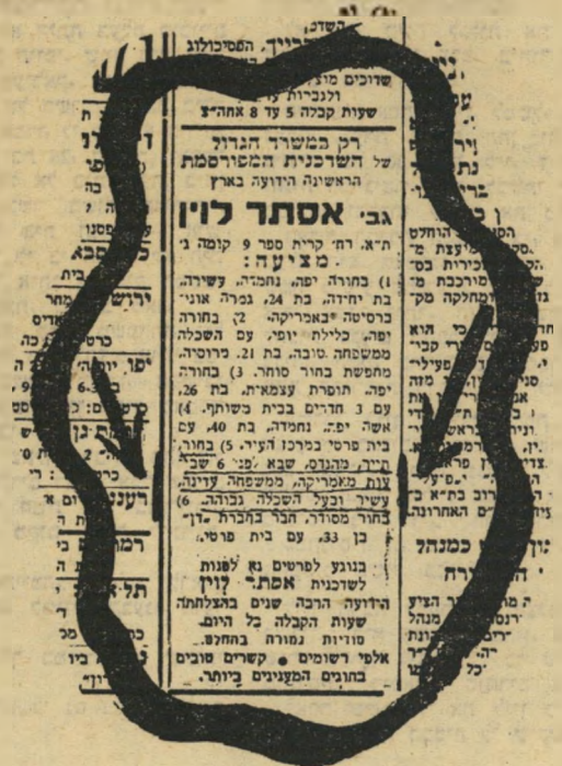
מאת יוחנן זביא

שאלתי את אסתר: "מדוע צעירה כמוך צריכה לחפש חתן בדרך זו?" היא השיבה: אבי איש אדוק. לא רצה שאשאר בתולה זקנה. דרש שאצנה למוסד המכובד בעיניו: משרד השדכן."