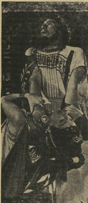
יוסטינוב ולאפן ("קו וואדיס") קצת טילוף היסטוריה

טוריאדור, אודות אמריקאי צעיר המחליט להיות לוחם-שחרים. סרט אכזרי, מבוים בידי לוחם-שחרים לשעבר, המכיל תמונות זירה מצוינות. גילברט רולנד.