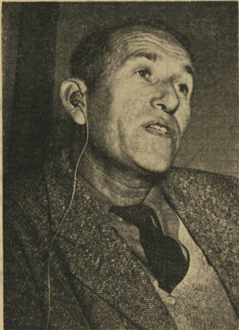
ד"ר חיים שיבא — הראשון נשאר