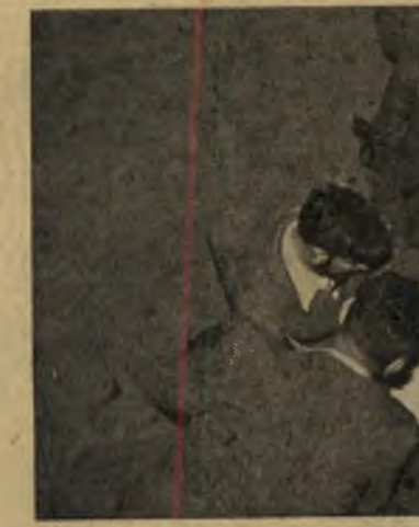
התיעצות חוליית-הכיסוי על כיפת ג'יפ לפני בנין הכנסת בשעה 12 נעצרו המכוונות

ישראלי היחיד שפירסם בשבוע שעבר תמונת ונת וכתבות על בחירת הנשיא, לא מאחר מן העיתונים היומיים.