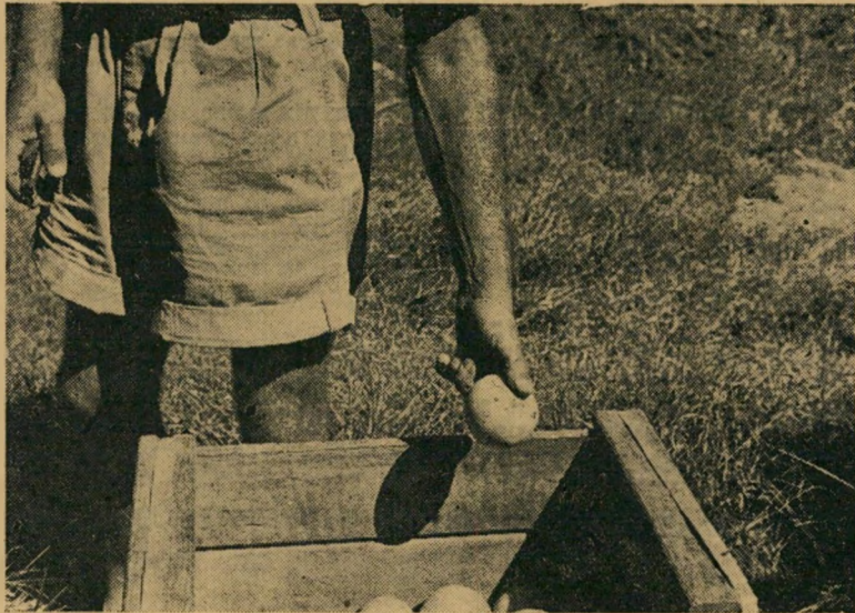
יותר'מהר, יותר זול. בתמונה למעלה נראית שיטת מילוי ארגוני התפוזים המקובלת: הפועל משליך תפוז אחד תפוז. לטמה: הדגמת השיטה הנכונה — שלושה במקום אחד.

האסירים שיכנסו למחנה יגורו בבתיים קט' גים, ינועו ללא הגבלה בין הכתלים, יעבדו בחוה ובבתי המלאכה השונים; גריה, מת' פרה, סנדלריה, ילמדו מקצוע שיאפשר להם