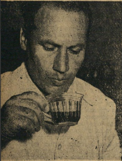
על חודרה של לשון. למרות הבדיקה המדע קיימת עדיין השיטה העתיקה של הסועס המקט עי. ביאב זכרון זהו תפקידו של המהנדס שפיר