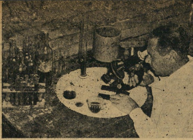
החיידיקים לעזרה. למעלה: מהנדס היקב במעבדתו. למטה: חיידיקים מיוחדים המוכנסים ליינ לגרום לתסימתו.