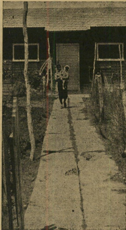
קיום עצמאי . כל תושב הכפר קבל חצי צריף בו הוא מקיים את עצמו ואת משפחתו מעבודתו באחד המקצועות שלמד בבתי המלאכה של הכפר.