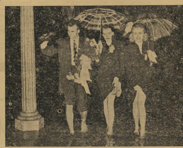
בני-עשירים בלוסיאנג'לס... החלל תפוס ע"י עניני מין...

דירות, מחשש פן ירד ערך הדירות. לאמריקאים יש שלש טענות להצדקת עצמם: מצב הי כושים הולך ומשתפר בלי כל ספק (משפטי הליניץ) כמעט נעלמו, כושים חדרו למקצועות רבים, ראלף בניץ עשה קאריירה בינלאומית; רמת המחיה של הכושים גבוהה מזו של רוב עמי העולם; עמים מתחסדים רבים נוהגים באותה צורה במיעוטים הלאומיים שלהם (בישראל בערבים, אנגליה בכושים).