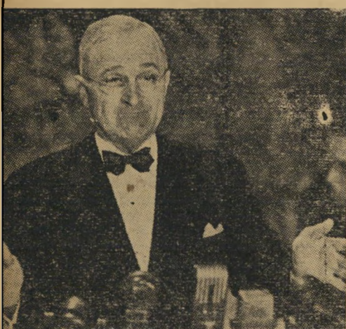
הארי טרומן באסיפת המפלגה הדימוקרטית... מפא"י והפרוגרסיביים, יחד עם בעלי האחרון

אין מדינה בעולם אשר בה תופסת הנשים עמדה כה מרכזית, בראש ובראשונה, בחיים הפוליטיים. בעוד שהגבר