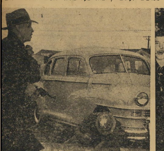
קצין משטרה כרדיפה אחרי פושע... להשתמש בנשק חס כדי להרוג...

עניני האינדיאנים מנוהלים על ידי פקידים לבנים, שהם מעין אפוסטרופסים. רוב האינדיאנים חיים בעוני ממאיר, רחוק קים מאד מן הרומנטיקה של ספרי הילדים. אויבי אמריקה מתרכזים בעיקר על הבעיה הכושית. שחוריה העור הובאו על ידי סוחרים עבדים מאפריקה, לעבד את שדות הכותנה של מדינות הדרום. מספרם קרב כיום ל-15 מיליון, כעשירית האוכלוסייה.