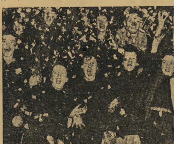
חובבות כדור-כספים מעוררות את קבוצתן... המגיעה לעתים למחמים של שגעון המוני...