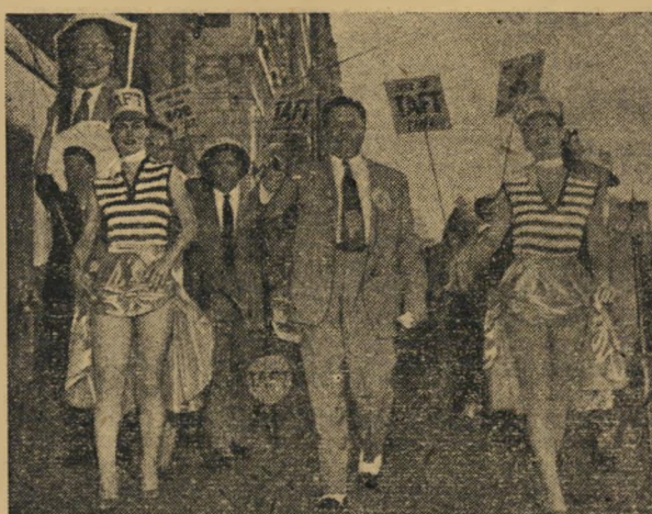
הפגנה פוליטית בעזרת רגלי בחורות... שיטות תעמולה, הקוחות מן הקרקס...