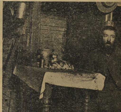
מהגר יהודי בראשית המאה

"...החברה הגבוהה מורכבת אך ורק מן העשירים..."