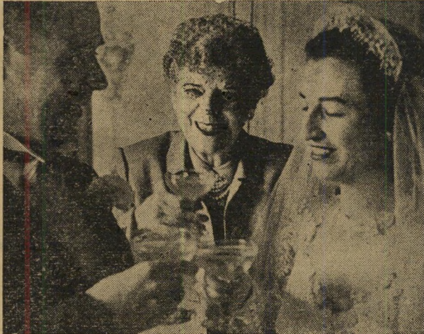
חתונה בחברה הגבוהה

"...החברה הגבוהה מורכבת אך ורק מן העשירים..."