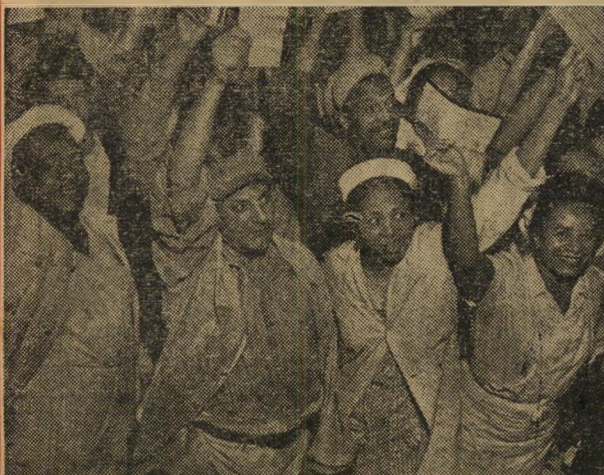
פועלים לבנים ושחורים מפגינים בצוותא "...משפטי הלינין' כמעט נעלמו..."

באנגליה שורר משטר אריסטוקרטי. החברה הגבוהה מורכבת ממשפחות האצולה או המעמד הבינוני הגבוה. משפחות אלה רגילות זה דורות ונהל את המדינה. בניהן לומדים בבתי-הספר האציליים, עוברים בדרך הטבע לפקידות המדינה. או לשרות המושבות, לדיפלומטיה, לצבא או להנה"ד