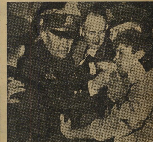
התנגשות בין שובתים ושוטרים "...מלוות לעתים קרובות במעשי אלימות..."