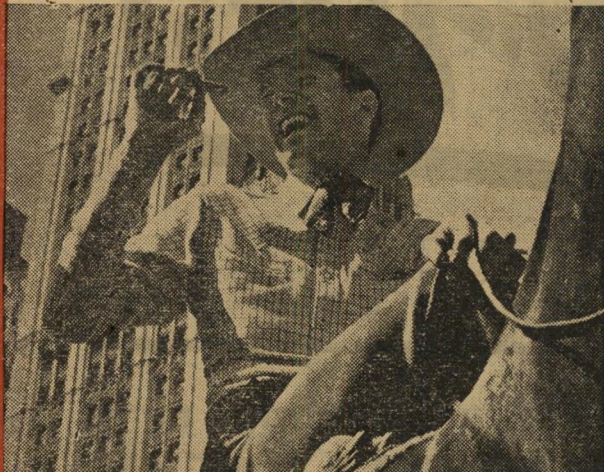
אלוף רכיבה במרכז ניו יורק "...בעיני זרים, אופי ילדותי מאד..."

מסקנה שניה היא שכל מפלגה פו"ליטית נאלצת להבטיח הבטחות לכל עדה של מהגרים. בעוד שמועמד פו"ליטי בישראל ישים מטבעו את הדגש על שאיפותיו הישראליות הטהורות, נותן המועמד האמריקאי הבטחות ודברי עידוד לפולנים ולאטלקים, ל"מקסיקאים וליהודים. מכאן ההבטחה הפתאומית של אייזנהאור "לשחרר" את פולין, והבטחת שני המועמדים לתמוך במדינת ישראל. לו היתה בארצות-הברית עדה ניכרת של מהגרים ערביים, היתה ניתנת להם הבטחה הפוכה.