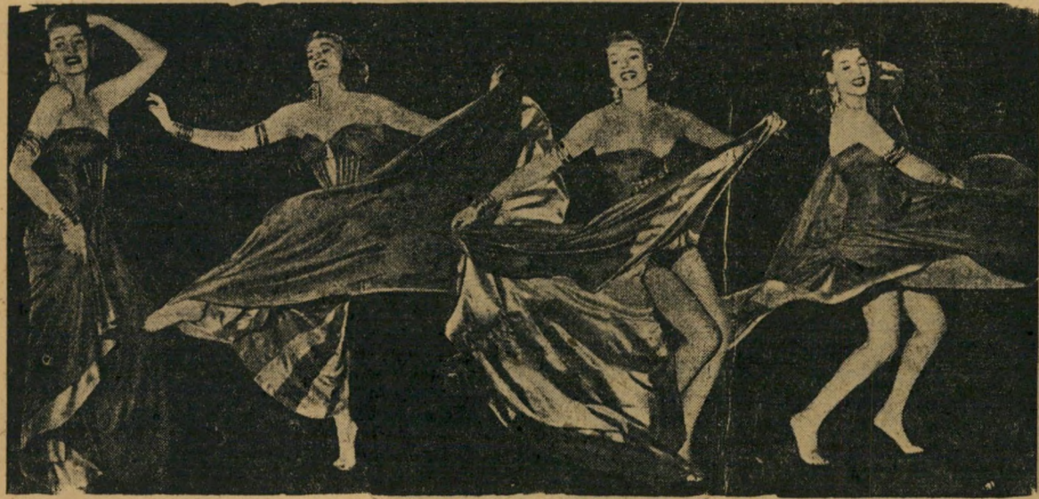
ריקודי ריטה היוורת (קרה זה בטרינידאד) ללא כשרון, אישיות קולנועית

אלזה לודנסטריין (קלוד נוליה), רופאה נאי שמת ברצח הרחמים של מאהבה, הולה חשוך מרטה. היא מובאת למשפט וחבר מושבעים מתמנה לחרוץ עליה דין. הסרט משתדל להר' כיה שמשפט צדק לא ייתכן; אנשים אינם מסוגלים להיות אובייקטיביים במידה הזאת שיוכלו להחליט בכנות אם הנאשמת חייבת ברין או לא. כל מיני גורמים צדדיים עוזרים לעוות את הדין. סרטו של הבמאי (ומחברו החוקי של הסרט) אנדרה קאזאט, אף על פי שזכה בפרס הגדול בפסטיבל בונציה לפני שנתיים, אינו יותר