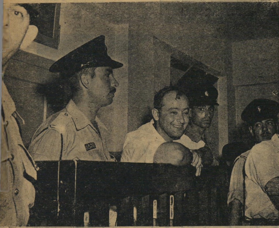
שילנסקי - מה הוא רצה ובשם