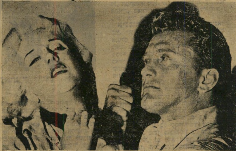
קרק דאג'יאס וגיאן סטרלינג (מצפוניו של עתונאי) אהבים עם אשה לא פחות מתועבת

הצפור הכחולה רחפה בשלוחה כימי קדם ביער האגדות, בחברתם של כיפה אדומה, לכלוכית, שבעת הגמדים והענק הרשע. ביום בהיר אחד — כלפני 50 שנה — בא ותפס אותה מוריס מטרלינק, המחזאי הבלגי. הצ'פור שקשקה בכנפיה ביאוש ואז תלה הסופר בצווארה שלט: "זהירות! זהירות! אינני ציפור אמיתית, אלא סמל המסמל את האור שר שבחיים!" כתוצאה מכך, נרגע העוף המסכן, הרכין ראשו, השתדל להשלים עם גורלו. על סמך הצלחתו, התאור מטרלינק שוב, חזר ליער, לקח גם את הנסל נגרסל, את המכשפה, ועוד כמה שרים, שדות ורוחות למיניהם, והחל לכתוב מחזה. הדבר לא היה קשה במיוחד והסופר עשה כמיטב יכולתו. לבסוף, כראוי לפילוסוף, לא שכח להכניס בתוכו כמה דברי חכמה עמוקים כמו: "בכל מקום טוב, אולם הטוב ביותר בכית" ו"כבד את אמך!" "איהו גבור — הכובש