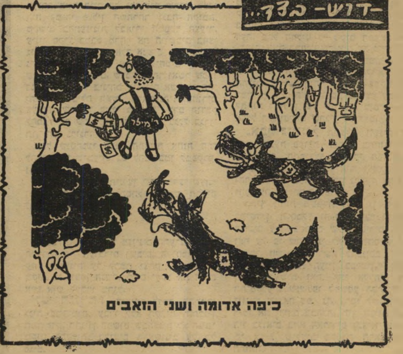
כיפה אדומה ושני הזאבים