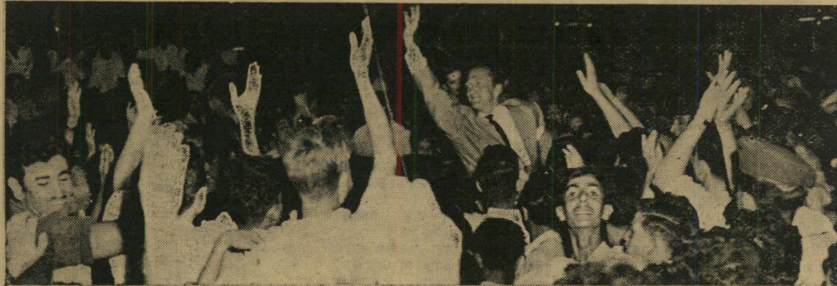
אריה הקולנוע קירק דוגאם ומעריציו בכיכר מוגרבי, תל-אביב

בקנה מידה כה גדול דורשת פרסומת ותע-מולה רחבים ביותר. אכן, הולברנד שמה מן הרגע הראשון את הדגש על שני גורמים אלה. אחד מאמצעי הפרסומת הבדוקים ביותר היה טיפוח פולחן כוכבים. עוד מראשית