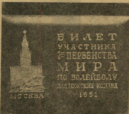
כרטיס ההזמנה: "יעקב פרחי, ישראל"

הפגנת ימיה. רק במשחק נגד פינלנד, שהגיעה אחר בניגוד לשאר הקבוצות, לחסום את הנחיתות ישראל, ניגפו במוסקבה ורק ניצחון זה איפשר לנבחרת לזכות במקום בחישוב, כיוון שנתאזן עם נצחון לבנוני על הנבחרת ה