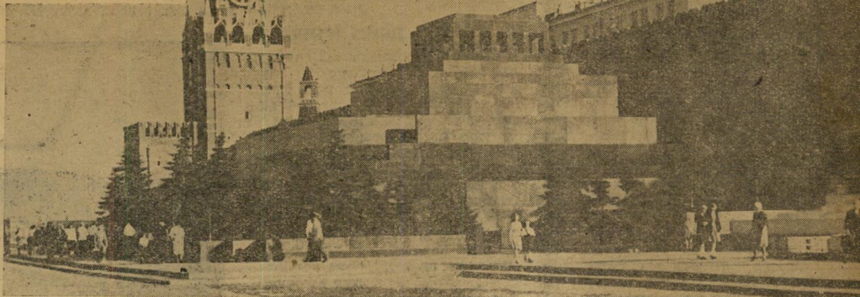
הקרמלין וקבר ודאדיומור איליין לנין

טיול לפריס, ניו-יורק או רומא הוא בחו"ק מותרות לאזרח הישראלי, ייתכן רק בעזרת קצת מזל והרבה כסף, דבר של מה בכך לתיירי המערב בעלי השפע של מטבע קשה. החודש קינאו תיירים רבים בארבעה עשר בחורים ישראלים שחזרו ממוסקבה לאחר השתתפות באליפות העולם בכדורעף, החוייה