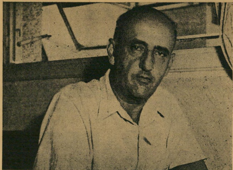
נציב מס הכנסה וגזבר עירייה בוציון ארגוב 20 מיליון לירות + 400 עובדים

אולם יותר מכל פרט משפטי עניין את חוקרי המשטרה פרט אישי בהחלט: האם עשתה האשה די אחת עם אבי הנערות כדי