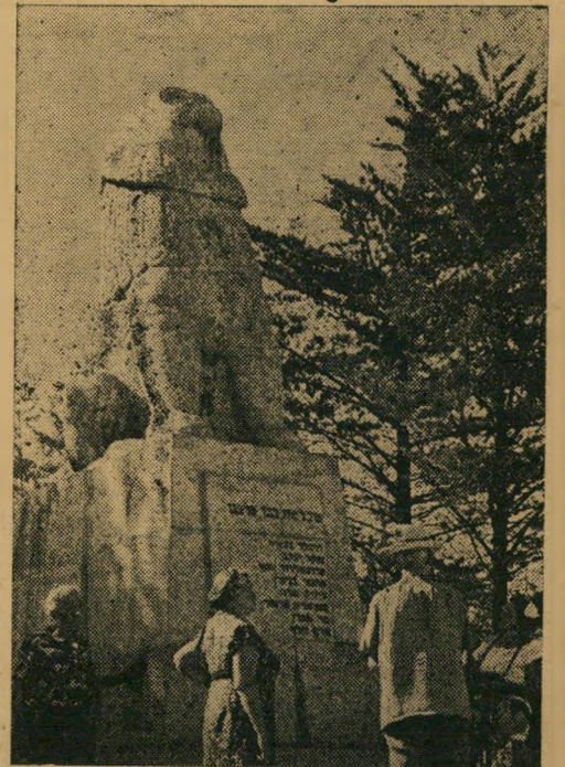
ידד אריה תניחי: קבר טרומפלדור והכרוז

מגדרים ואוטובוס אחד, לא קיבלו עד היום שום פיצוי בצורת רשיון יבוא. וזאת למרות שהיווה לעתים קשר יחיד עם נמל ים סוף, שרת לעתים קרובות את רשות הנגב הממשלתית. במקום זה קבל ענק הקואופרטיבים אשד את הזכויות לנסוע לאילת.