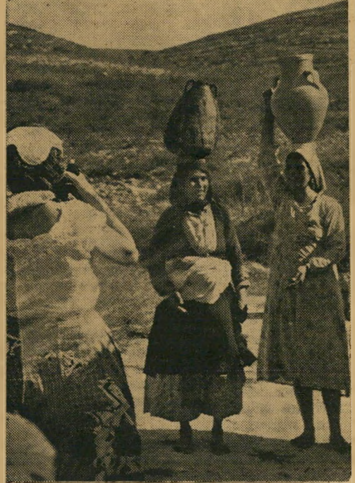
תמונות חינוכיות לתיירים: צילום הווי ישראלי

ש לושה הדולרים שחברת יתור מקבלת מכל תיור עבור שלושת ימי הטיול, כולל נסיעה, ההדרכה, לינה ואוכל, הם עסק כדאי למדינה. בשנה האחד רונה הכנים יתור לאוצר צמאי-הדולרים לא פחות מ-100,000 דולר (לא כולל את ההכנסות מהמטיילים מבני הארץ, המשלמים עבור אותו טיול גלילי סך של ארבעים לירות ישראליות). מ-100,000 דולר אלה קיבל בינתיים הקואופרטיב הבטחה לשחרור עשרה אחוזים במטבע זר לקניית חלקי חילוף, אך הבטחה בלבד. מבחינה ממשית, הסביר לנו איש יתור בגליל, בהפי נותו את מחשבותיו לנגב, קיבלו בתור תודה על הכנסת כסף טוב למדינה, עד היום דבר אחר: נישול מקו טיול לאילת, שהם היו חלוציו, המשיכו להפעיל אותו גם כשהפסידו עליד כך, מתוך תקווה לרווחים כשיתבססו. התקווה היתה תקוות שוא. במשך שנתיים הרס יתור בנסיעות לאילת ארבעה