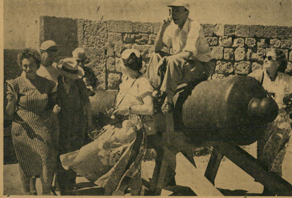
על תותחי עכו: תיירים ובני הארץ ליד התותחים שהניסו את נפוליאון לפני 150 שנה

הצדקתנו היחידה למצב העניינים העצוב: שכא נשים קשורים לרוב לעיר, אנו כמעט שוכחים שהאדף מקיפה עוד איאלה יישובים מלבד תל-אביב, שבכל זאת צצו נקודות חדשות רבות מתאדמה ושלא כל העולים