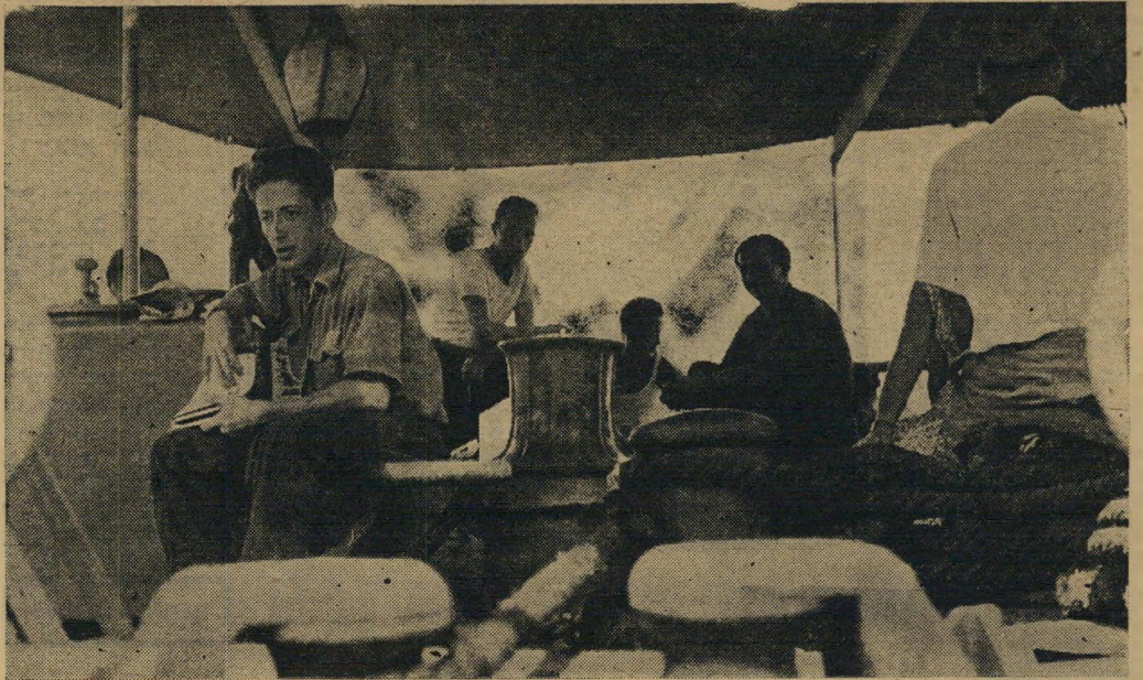
החוזרים ב"חדר השינה" על הסיפון בלשונות רבות: חוברות מצויירות

כי היהודים, פליטי הפרעות במזרח אירופה, שהיגרו לארצות-הברית בראשית המאה, שרפו לרוב את כל הגשרים מאחוריהם, לא יכלו — וגם לא רצו — לחזור לארצות מוצאם, אף אם קלייטתם בארץ החדשה לא עלתה. גם העולים-המהגרים שבאו לישראל עם עליית המדינה בת 700 אלף הנפשות פועלים בהתאם להנחה זאת, נאחזים בצפרניהם בארץ החדשה, אף אם אין הם מצליחים להקלט בה קליטה של ממש. ונראה, שרק מעטים מוצאים עוז בנפשם להגר מן הארץ, אליהם נמנים: 35 החוזרים להונגריה.