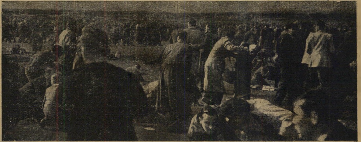
הצופים במיפגן פרנבורו נופלים לארץ עם התרסקות ה-110

המטכיל הצ'כוסלובקי החליט להביע את הערכתו המלאה לדרך האולימפי בעל שלר- העצמאות, אמיל ז'ופק; שבועיים אחר שובו מהלסינקה העולה מדרגת סרן ב- צבא הקבע הצינכי לדרגת רב-סרן. מייג'ור שמואל וייזר, יצור-הטכס- שיל היהודי-אנגלי שהתפרסם בתמיכתו הפעיר-