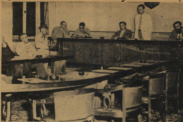
ישיבת מועצת עיריית ירושלים בהעדר נציגי האופוזיציה לכסאות הריקים, הכרעה

בע הגדלת שער הדולאר לסחורות המובאות. בינתיים חלו גם חילופי גברא בממשלה לאחר הבחירות בכנסת. הרמן הולנדר הסתלק ודוב יוסף לא התלהב מפוקארו. הסתורות נשארו בנמל חיפה כאבן שאין לה הופכין ופיליפ התכונן להחזיר לאיטליה. בינתיים חל שוב מפנה. מחירי מוצרי הסקסטיל ירדו בשוק העולמי בצורה קטנה טרופלית. פיליפ חשב ומצא שלא כדאי להוציא את הסחורות מהארץ והחליט להיפטר מהן ויהיה מה. הוא פנה שוב למשרד המסחר והתעשייה והוכנה טיוטה להסכם חדש. פיליפ יספק חמרי גלם במחיר כפול משווי הסחורות שהביא ומשרד המסחר והתעשייה יתיר לשווק את הסחורות בארץ באופן חפשי. ההסכם עמד להיחתם; אולם בינתיים התערבה המשרה הכלכלית. שעצרה את כל השותפים לעסק באשמת הוצאת סחורות מהגמלים במיסמכים מזוייפים. אלכסנדר פיליפ נוכח לדעת, שקל להגיע לישראל אבל קשה לצאת ממנה.