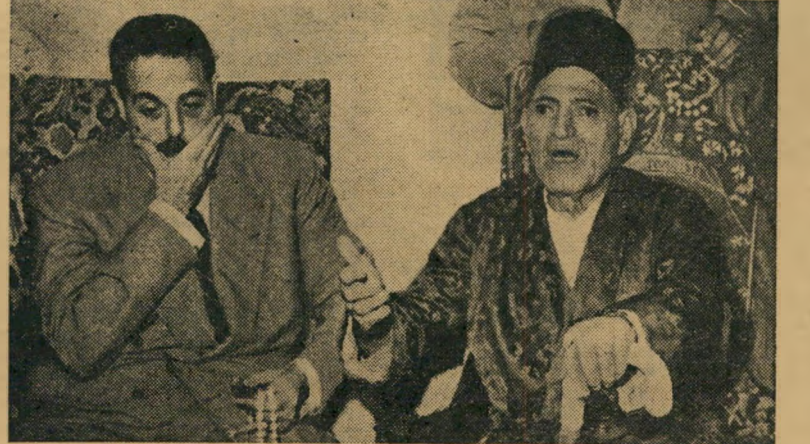
מוסטאפא נחאס ופואד סראג אל-דין. שאתה רוצה לנשכה ו'...