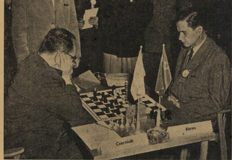
קרם (ברית-המועצות) נגד צ'רניאק (ישראל) בארץ של צנע, ספורט לאומי

במאמרו הראשי מתאר השבועון אל-ציאד אינו הפיכה דרושה לעם הלבנוני. „אין