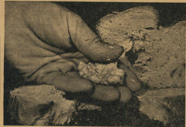
לחם: קלוקל, רטוב ומסוכן לבריאות. בהודשי הקיץ: מחלה טרופית

כעבור 12 שעות היו שלוש מתוך ארבע החלות מוטלות בפח האשפה, המשפחה נאל- צה להסתפק במצות שונתרו לפליטה מפסח. הסיבה: הלחם, שנראה כה טוב ולבן הפך