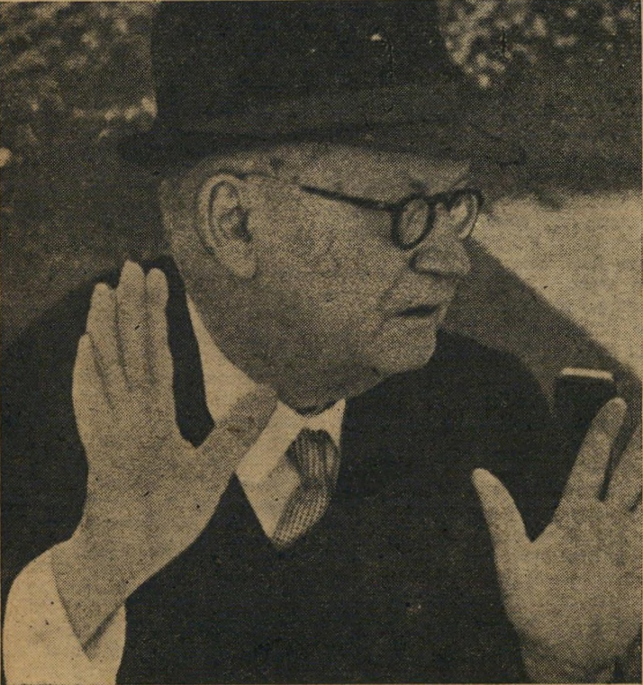
מאלאן הכומר: ראש הממשלה, דניאל מאלאן, שפנה בעיני העולם סמל הריאקציה והשינאה הגזעית המשתוללת וקצרת-הרואי, הוא אדם דתי המאמין בכל לבו שדיכוי הגזעים הוא מצוות האלוהים, שבאה לידי גילוי בתנ"ך. תוצאת פעולתו עלולה להיות הפוכה: סיפוח לאומנות וסחורה, נגדילבנה קיצונית.