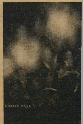
יה, ביניהם קצינים גבוהים כל הגזעים הזכות לחופש.