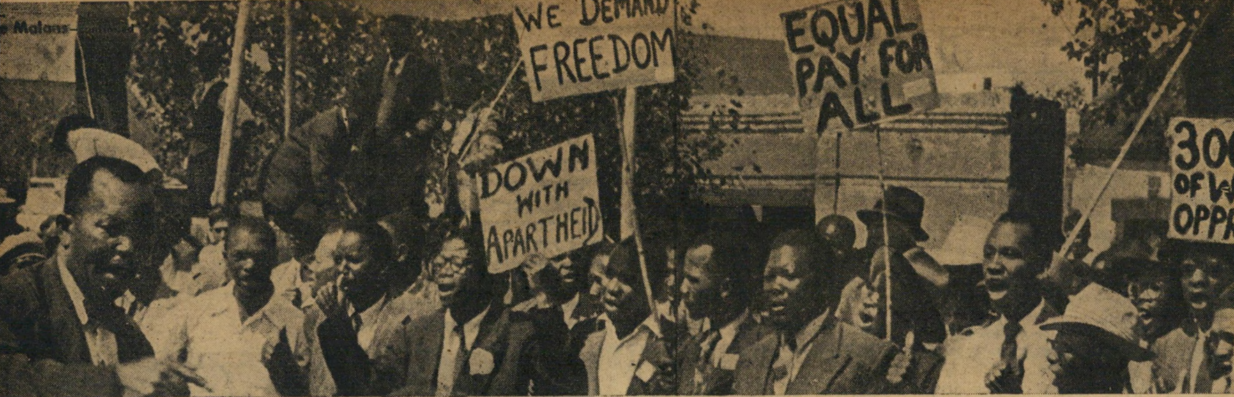
למחצה, אשר מאלץ החליט לשלול מהם את זכות הבחירה הישירה. הסימנות: זכות בחירה לכל ו" — 300 שנה של דיכוי לבן ו" — תשלום שווה לכל ו" — אנו דורשים חופש ו" —

בנושה גם את רוב הלבנים, בעוד שעמדת ה"מתנדבים" של תנועת המרי מלאה נאווה את לבות הלא-לבנים. יותר ויותר כושים והודים, לדיעהם וחסרי ההכרה עוד אתמול, נסחפו בזרם התנועה. אלפים התנדבו להמשך הפעולה. הממשלה, ההלה להיות אובדת עצות. היא החלה מחליפה את עונש המאסר בעונש מלקות למתנדבים עד גיל 21. אולם הדבר לא הועיל — המתנדבים ידעו ממילא שצפויות להם מכות במרתפי המשטרה. בתי-הסוהר עברו על גדותיהם. בכמה מקרים אף כרבי מנהלי בתי-הסוהר לקבל את האסירים מחוטר מקום.